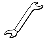
wrench tool (included)

A -Outlet box screw x 2 B -Black wire (L) from junction box C -White wire (N) from junction box D -Green wire/bare copper (G) from junction box E -Black wire (L) from fixture F -White wire (N) from fixture G -Green wire/Bare copper from fixture H -wire connector x 3